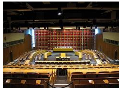
ห้องประชุม ECOSOC ในนครนิวยอร์ก

ECOSOC เป็นเวทีสำหรับการอภิปรายในเรื่องการพัฒนาเศรษฐกิจ สังคมและสิ่งแวดล้อมอย่างยั่งยืน และแสวงหาข้อตกลงร่วมกัน ประกอบด้วยผู้แทนสมาชิกจำนวน 54 ประเทศ มาจากการเลือกตั้งของ UNGA โดยที่กฎบัตรสหประชาชาติได้ระบุหน้าที่และอำนาจของ ECOSOC ในการปรับปรุงฐานะทางเศรษฐกิจ สังคม วัฒนธรรม การศึกษา และสาธารณสุข และให้คำแนะนำเรื่องดังกล่าวต่อสมัชชาสหประชาชาติ รัฐสมาชิก และทบวงชำนาญพิเศษที่เกี่ยวข้อง ให้ข้อเสนอแนะเพื่อส่งเสริมการเคารพและการปฏิบัติตามหลักสิทธิมนุษยชน จัดเตรียมร่างอนุสัญญาและเรียกประชุมระหว่างประเทศในเรื่องที่อยู่ในขอบเขตอำนาจของ ECOSOC และทำความเข้าใจการดำเนินงานของกลไกด้านสิทธิมนุษยชนส่วนใหญ่จึงรายงานในที่ประชุม ECOSOC ก่อนที่จะได้รับการพิจารณาในที่ประชุมสมัยสามัญของ UNGA ต่อไป