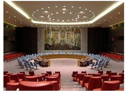
ห้องประชุม UNSC ในนครนิวยอร์ก

UNSC ประกอบด้วยสมาชิก 15 ประเทศ โดยแบ่งเป็น 2 ประเภท คือ สมาชิกถาวร 5 ประเทศ ได้แก่ สหรัฐอเมริกา สหราชอาณาจักร ฝรั่งเศส จีน และรัสเซีย และสมาชิกไม่ถาวร 10 ประเทศซึ่งมาจากการเลือกตั้งตามกลุ่มภูมิภาค 5 กลุ่ม สมาชิกไม่ถาวรมีวาระการดำรงตำแหน่ง 2 ปี มีหน้าที่รับผิดชอบ เช่น การระงับกรณีพิพาท รักษาสันติภาพและความมั่นคงระหว่างประเทศ การกำหนดภารกิจของกองกำลังรักษาสันติภาพ และร่วมมือกับคณะกรรมการฝ่ายทหารในการกำหนดแผนการลดอาวุธ โดยสมาชิกสหประชาชาติตกลงยอมรับที่จะมีพันธกรณีในการปฏิบัติตามคำวินิจฉัยหรือข้อมติของ UNSC ดังนั้น ข้อมติของ UNSC จึงมีผลผูกพันทางกฎหมายที่ประเทศสมาชิกต้องปฏิบัติตาม ทั้งนี้ การละเมิดสิทธิมนุษยชนอย่างร้ายแรง เป็นระบบ หรือกว้างขวาง อาจตกอยู่ในอาณัติของ UNSC ได้