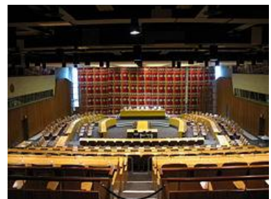
ห้องประชุม ECOSOC ในนครนิวยอร์ก

ECOSOC เป็นเวทีสำหรับการอภิปรายในเรื่องการพัฒนาเศรษฐกิจ สังคมและสิ่งแวดล้อมอย่างยั่งยืน และแสวงหาข้อตกลงร่วมกัน ประกอบด้วยผู้แทนสมาชิกจำนวน 54 ประเทศ มาจากการเลือกตั้งของ UNGA โดยที่กฎบัตรสหประชาชาติได้ระบุหน้าที่และอำนาจของ ECOSOC ในการปรับปรุงฐานะทางเศรษฐกิจ สังคม วัฒนธรรม การศึกษา และสาธารณสุข และให้คำแนะนำเรื่องดังกล่าวต่อสมัชชาสหประชาชาติ รัฐสมาชิก และทบวงชำนาญพิเศษที่เกี่ยวข้อง ให้ข้อเสนอแนะเพื่อส่งเสริมการเคารพและการปฏิบัติตามหลักสิทธิมนุษยชน จัดเตรียมร่างอนุสัญญาและเรียกประชุมระหว่างประเทศในเรื่องที่อยู่ในขอบเขตอำนาจของ ECOSOC และทำความเข้าใจ/ประสานกิจกรรมกับทบวงชำนาญพิเศษ ผลการดำเนินงานของกลไกด้านสิทธิมนุษยชนส่วนใหญ่จึงรายงานในที่ประชุม ECOSOC ก่อนที่จะได้รับการพิจารณาในที่ประชุมสมัชชาสามัญของ UNGA ต่อไป