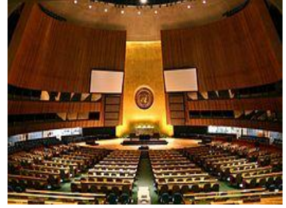
ห้องประชุม UNGA ในนครนิวยอร์ก

ข้อมติผ่านคณะกรรมการย่อยชุดต่างๆ ได้แก่ คณะกรรมการ 1 (การลดอาวุธและความมั่นคง) คณะกรรมการ 2 (เศรษฐกิจ การคลัง และสิ่งแวดล้อม) คณะกรรมการ 3 (สังคม มนุษยธรรม และวัฒนธรรม) คณะกรรมการ 4 (การเมืองพิเศษ และการปลดปล่อยอาณานิคม) คณะกรรมการ 5 (การบริหารและงบประมาณ) และคณะกรรมการ 6 (กฎหมาย) ในส่วนของเรื่องสิทธิมนุษยชนจะถูกพิจารณาโดยคณะกรรมการ 3 และข้อมติของคณะกรรมการ 3 จะถูกเสนอไปยังที่ประชุม UNGA เพื่อพิจารณาต่อไป