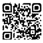
QR Code ร่างยุทธศาสตร์ฯ